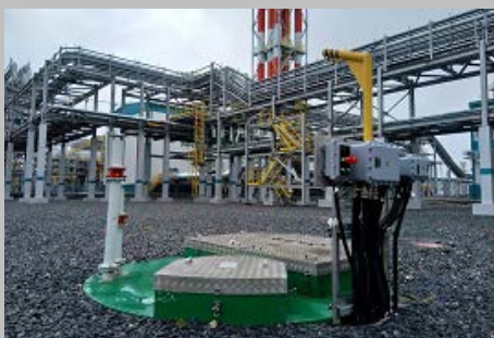
Производство и поставка 30-и комплектных КНС ПАО "СИБУР Холдинг" Западно- Сибирский Нефтехимический комбинат Г. Тобольск